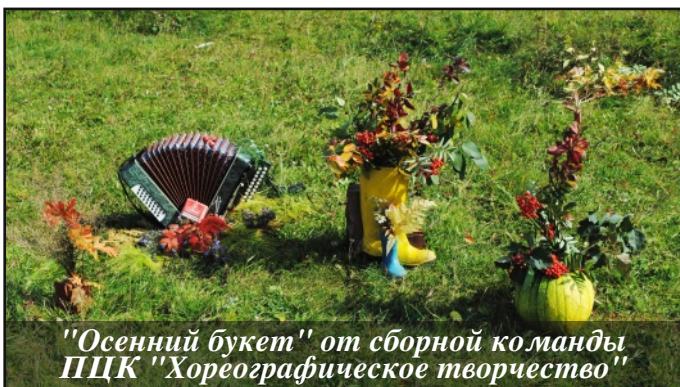
"Осенний букет" от сборной команды ПЦК "Хореографическое творчество"